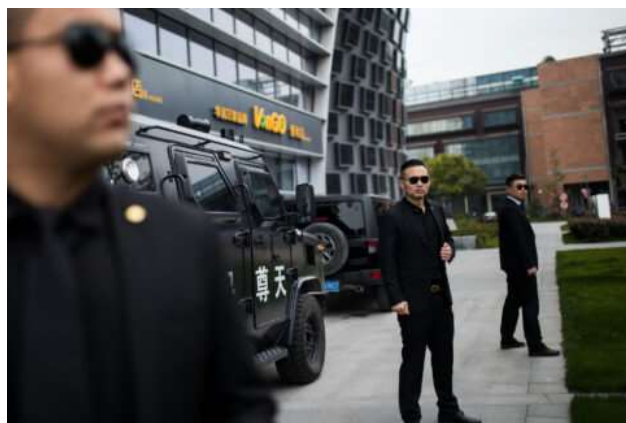
Empresas chinas de seguridad privada en América Latina