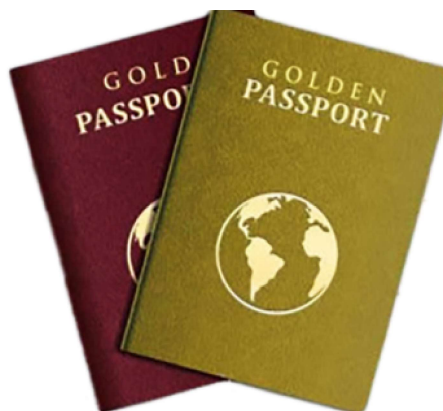
Banderas rojas entre pasaportes dorados: Un análisis de la influencia china en cinco programas caribeños de ciudadanía por inversión