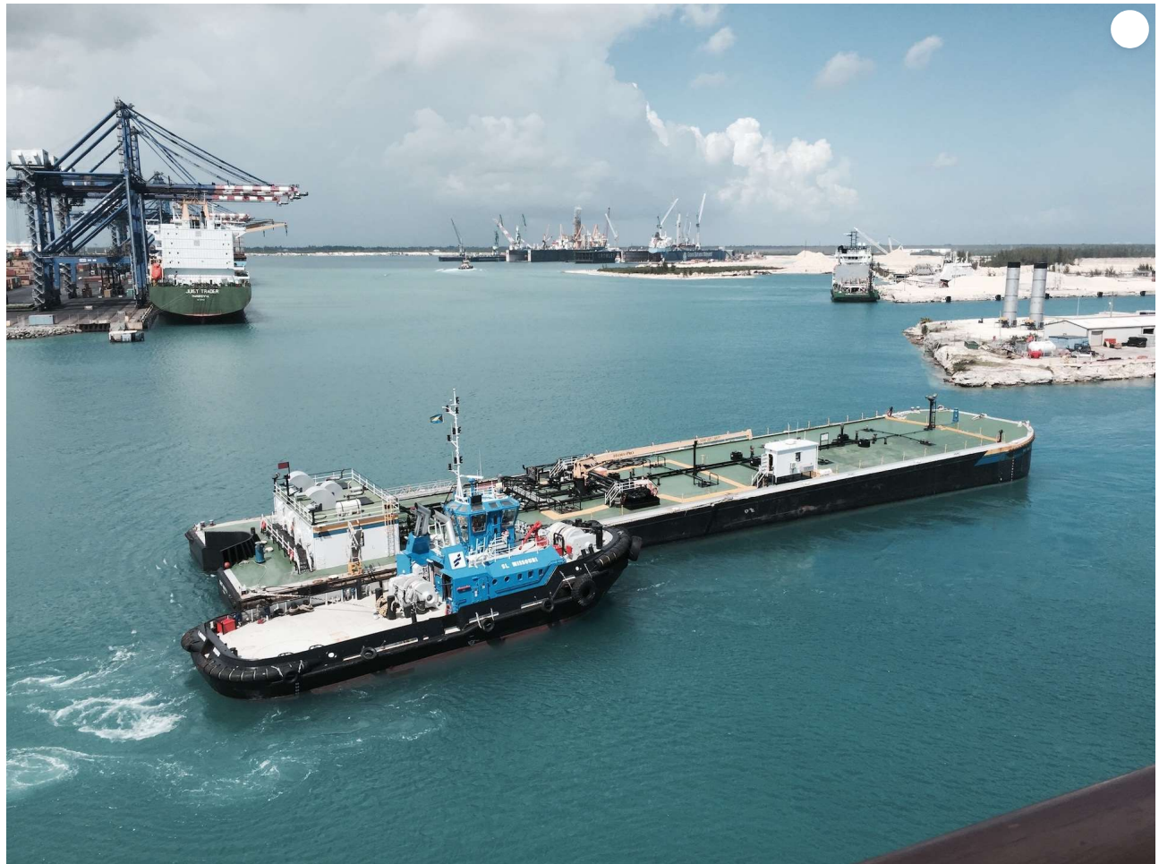
Puerto de Freeport con la terminal de contenedores al fondo, en Freeport, Bahamas, 13 de mayo de 2015. Hutchinson Port Holdings, filial de Hutchinson Whampoa, afiliada a la RPC, posee y explota el puerto de contenedores de Freeport, en las Bahamas.